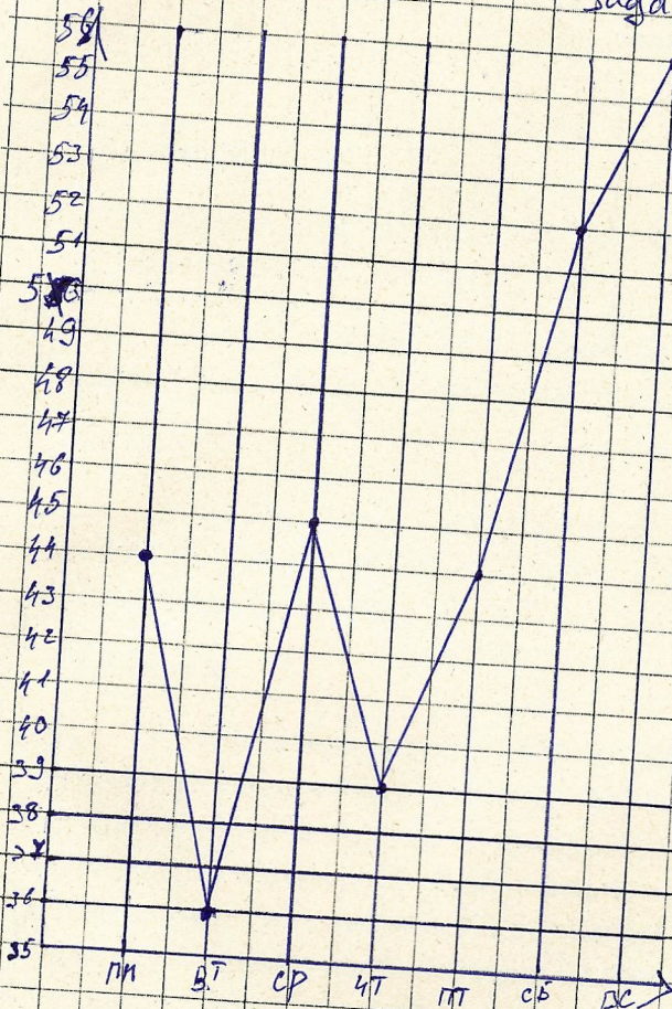
Задача № 8